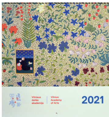
Vilniaus dailės akademija. 2021 kalendorius. V., 2020

Leidiny, kuriame pristatomi visi 99 praėjusiais metais Vilniaus dailės akademiją baigę magistrantai ir jų baigiamieji darbai.