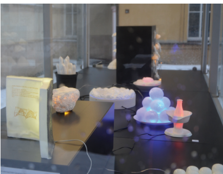
„Lauko ekspozicijoje“ rodoma Keramikos katedros studentų paroda „Pasisavintas 2“